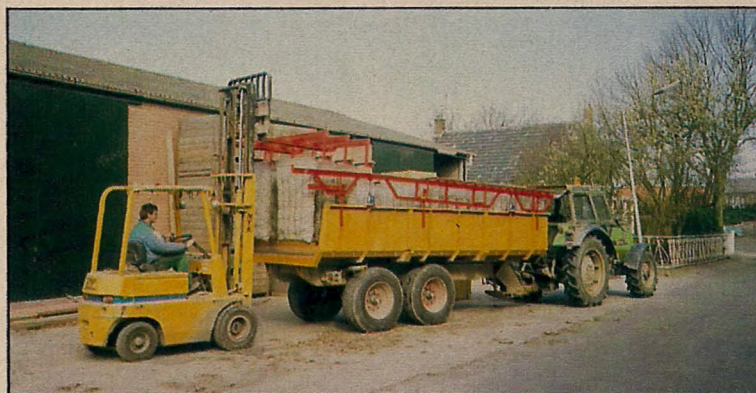
Met een heftruck zijn de voorkiemzakken eenvoudig te laden en te lossen. Het systeem bespaart ruimte en is arbeidsextensief

Bij het lossen worden twee zakken boven de pootmachine geschoven. Door het klitteband te openen, worden de zakken geleegd. De buizen worden vervolgens van de zakken afgeschoven